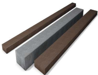
POUTRE ET SEUIL page 7