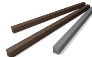
PROFIL CARRE PLEIN page 6