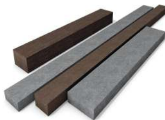
PLANCHE STANDARD sans ARMATURE page 9