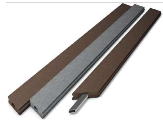
Planche avec rainure & languette avec ou sans renfort