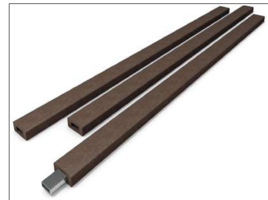
Planche standard avec armature