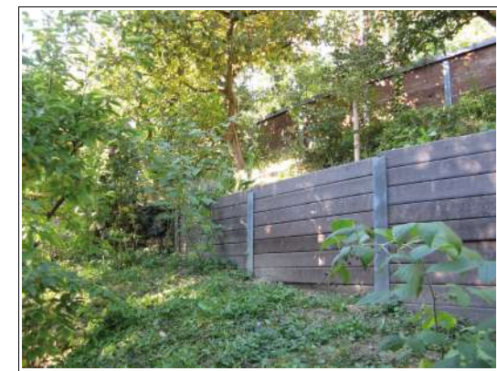
PLANCHE STANDARD sans armature