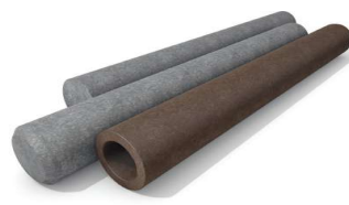
PROFIL ROND CREUX page 4