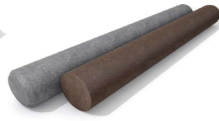
PROFIL ROND PLEIN page 3