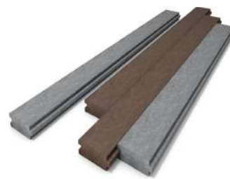
PLANCHE avec RAINURE & LANGUETTE avec ou sans RENFORT page 10