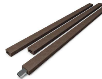
PLANCHE STANDARD avec ARMATURE page 11