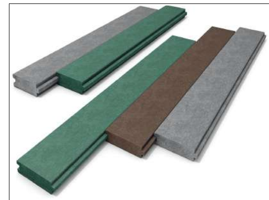
Planche spéciale avec rainure et languette