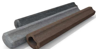
PROFIL ROND CREUX TRONQUE page 2