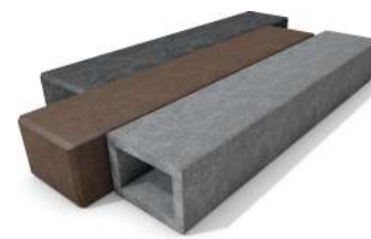
PROFIL CARRE CREUX page 5