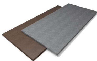
PLAQUE page 8